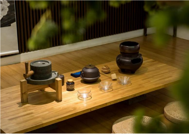
图 1 中国茶道文化