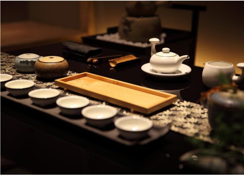
图 2 日本茶道文化