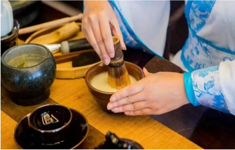
图 5 宋代点茶技艺

在宋代, 茶文化开始受到重视, 茶道的概念逐渐形成。点茶作为茶道的一种表演方式, 开始受到茶艺家的关注(图 5)。陆羽在其著作《茶经》中首次提及煮茶的方法, 其中就包括了点茶的技巧。他强调了水温的控制和水流的运用, 使得点茶成为一种独特的茶艺表演形式。