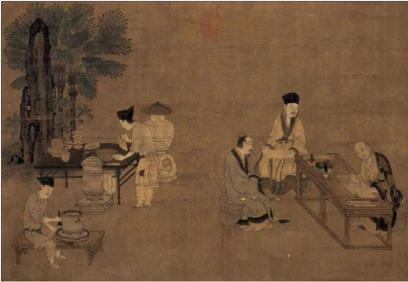
图 3 《卢仝烹茶图》，刘松年，宋朝